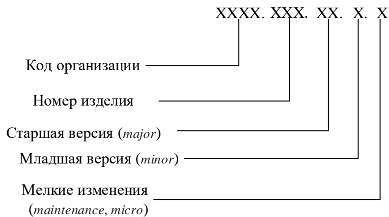
Рис. 1. Обозначение базовой версии ПО

Для идентификации базовой версии программы используется обозначение (рис. 1).